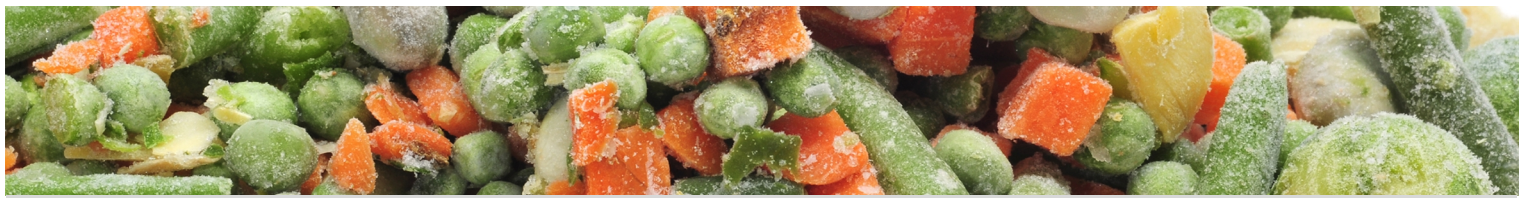
Table Top Fryser